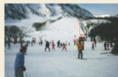
那須温泉ファミリースキー場