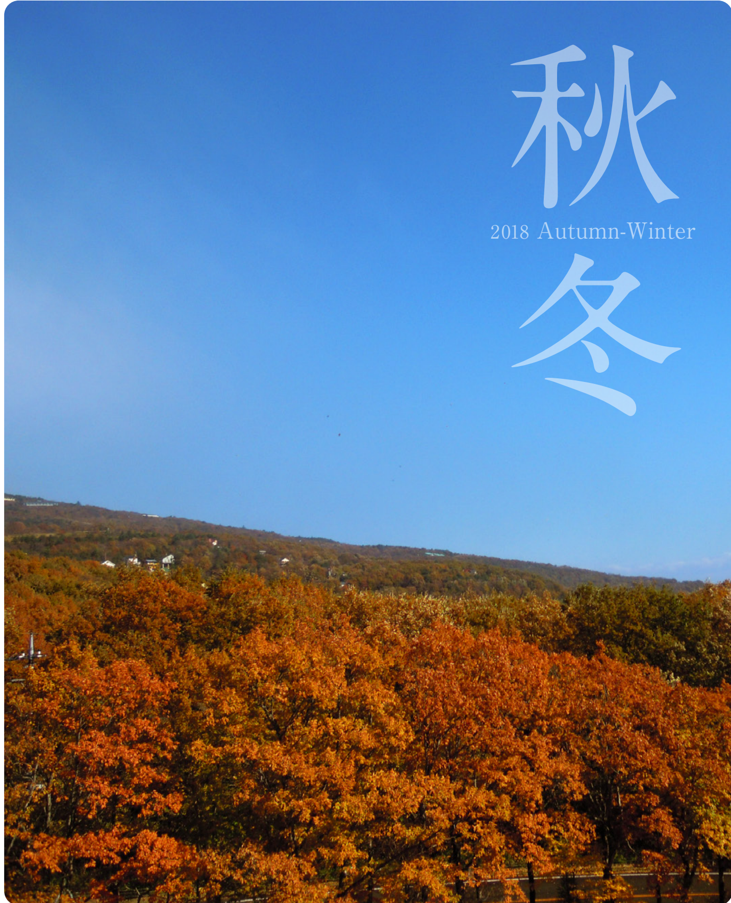
紅葉と青空のコントラストが美しい「那須ハイランド」