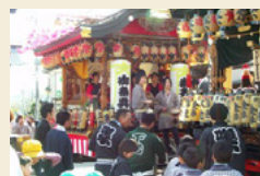
伊王野温泉神社付け祭り