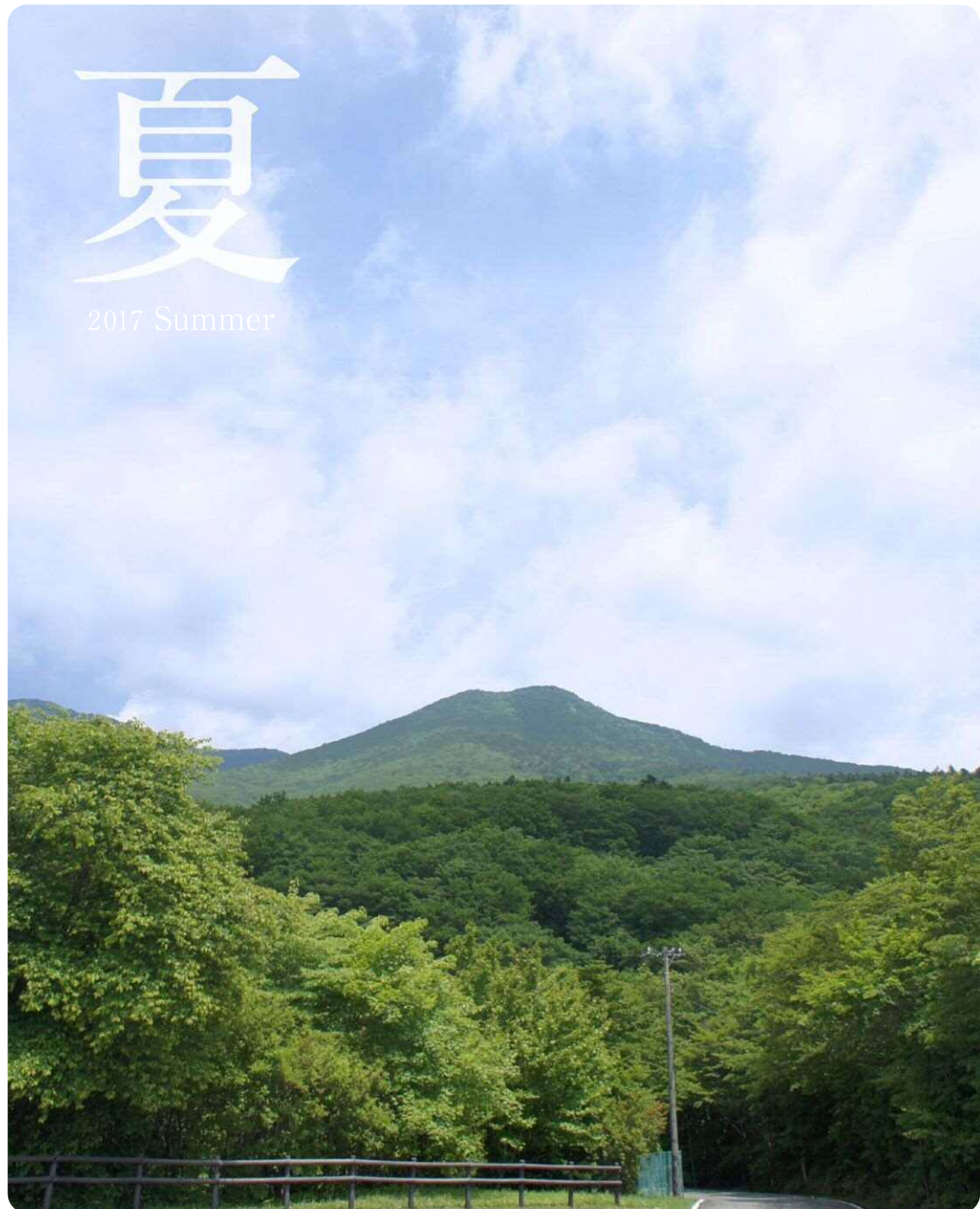
唐松平展望台より黒尾谷岳を望む