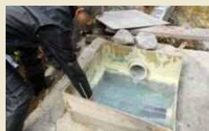
源泉にご案内することもできます