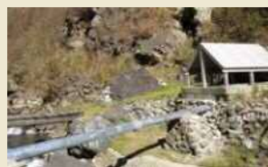
自然湧出している源泉