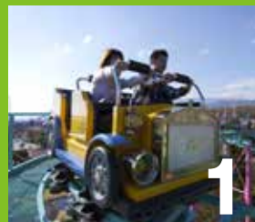
1 パニックドライブ 急カーブ急勾配のレールをクラシックカー型のライドで忙しく走り回る楽しいコースター。