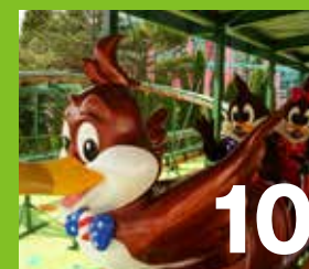
10 ウーピーコースター 那須ハイのキャラクター、「ウーピー」のコースター。お子様のコースターデビューにぴったり!