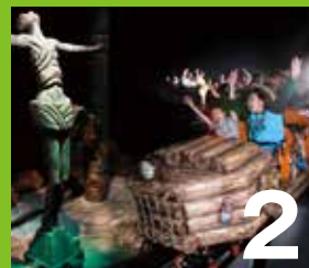
2 アドベンチャーコースター-SHINPI マヤの地底湖をめぐる大冒険! お子様から楽しめるアドベンチャーコースター。