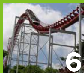
6 キャメルコースター-悟空 1,207mの長距離を時速80km/hで疾走。心臓破りのスピードがクセになる!