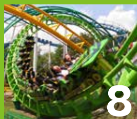
8 サンダーコースター 必殺の高速2回転。アタマもカラダも更には、悲鳴までねじれてスクリー状態に。