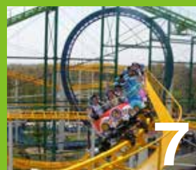
7 スピンターンコースター 遠心力で車両が不規則に回転、連続スピンのスリルと楽しさを同時体験。新感覚オリジナルコースター。