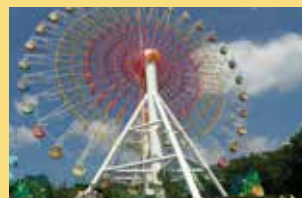
大観覧車 圧倒的な存在感の大観覧車。1周8分間の空中散歩で、雄大な那須高原の景観をお楽しみください。