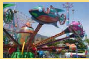
フライングサブマリン 上昇・下降を自分で操作し、水鉄砲から発射される水から逃げる新感覚の水系回転アトラクション。