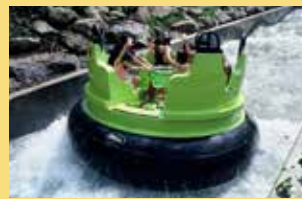
リバーアドベンチャー 水しぶきを上げ、激流に翻弄されながら川を下るアトラクション。