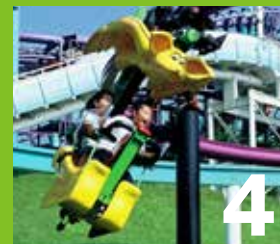
4 バットフライヤー タンDEM式の2人乗りマシンが約15mまで上昇し、回りながら滑空する爽快コースター。