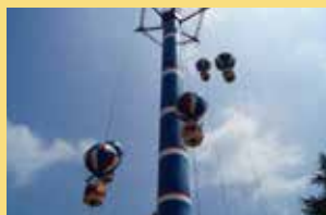
スカイバルーン バルーンに乗って空中散歩。那須高原の大自然を満喫できます。