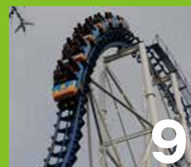
9 ビッグバンコースター 「那須ハイ」ナンバーワンの絶叫マシン。ほとんど垂直落下で急降下する究極のコースター。