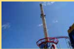
スペースショット 驚愕!!最高速度65km/hで58mの垂直タワーを一気に上昇!