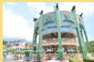
カルーセル 世界最大級！38mの2層式メリーゴーランド。老若男女を夢の世界へ誘います。