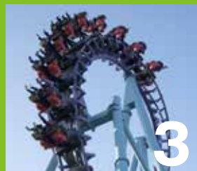
3 F 2 (エフ・ツー) 究極の絶叫マシン、エフ・ツー。宙ぶらりん状態で約2分間の恐怖飛行を体験しよう。