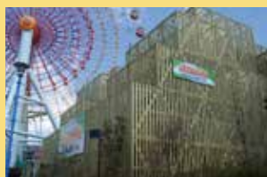
6層立体迷路「MeGaMo(メガモ)」 日本最大級6層建て立体迷路。「MeGa Monster maze」の略称どおり巨大な難攻不落の迷路。

10大コースターに加え、日本最大級の6層建立体巨大迷路や水系アトラクション、雄大な那須高原の景観が楽しめる大観覧車など、雨天でも安心な屋内型も含め39種類のアトラクションが揃っています。その一部をご紹介します。