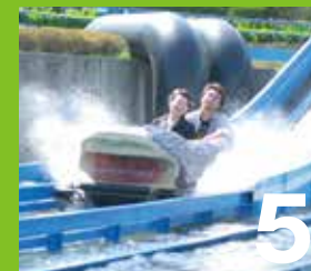
5 ウォーターコースター 丸太に乗って冒険気分。ゆるやかなレールに安心してると最後はとんでもない事に!?