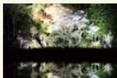
岩観音のライトアップ

31日 / 御神火祭 那須湯本の史跡殺生石で行われるこの祭は、過去数回の大噴火があった那須岳(茶臼岳)の怒りを鎮めようと、那須温泉神社に詣で那須岳(茶臼岳)の火を採火し御神火として崇めるようになり、いつしか無病息災・豊作を祈る行事となったといわれています。白装束に身を固めた氏子が大松明に火を灯すと、郷土芸能の白面金毛九尾狐太鼓の演奏が行われ、多くの人々を魅了します。暗闇に浮かび上がる狐の姿は、勇壮であり、妖艶でもあります。 ◎那須町湯本 殺生石