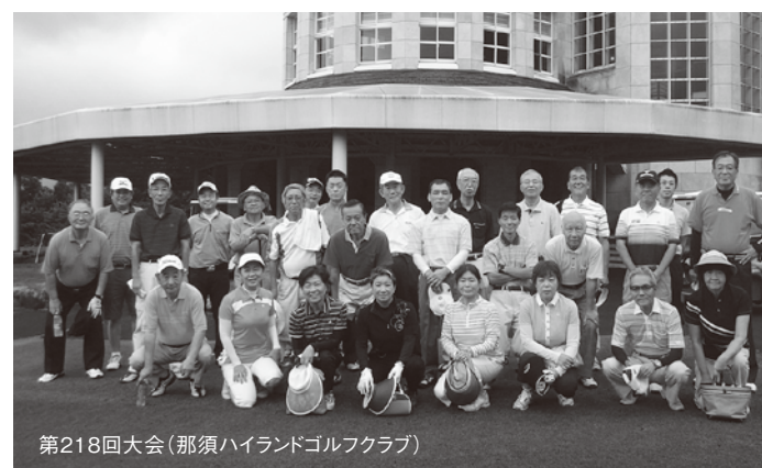
第218回大会(那須ハイランドゴルフクラブ)