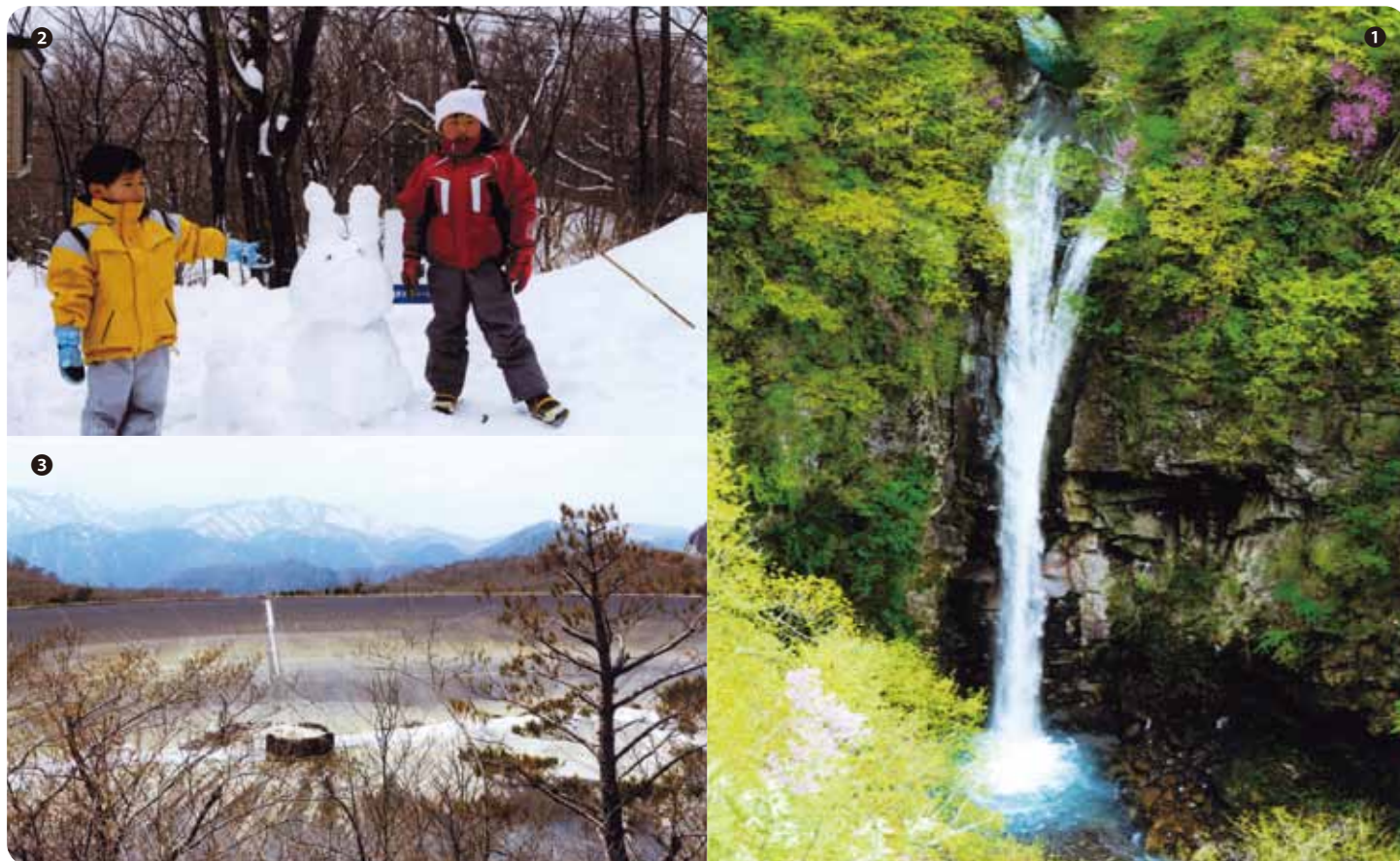
四季折々に魅力的な表情を見せる那須 ①平成の森 駒止めの滝 ②別荘で雪遊びのお孫さんたち ③沼原の調整池辺り

■オーナーズクラブ通信／第217回、第218回、第219回オーナーズクラブ大会の結果報告・第220回大会のご案内 ■ソーシャルクラブ通信／第16回「夏の音楽の集い」のご報告 ■緊急連絡メール配信サービスご登録のご案内