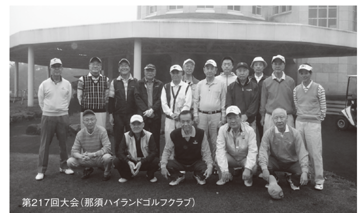
第217回大会(那須ハイランドゴルフクラブ)