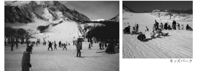
ファミリースキー場

◎那須岳登山指導センター/夏山登山の終了を迎え大自然に感謝の祈りと冬山の安全を祈願する神事を行います。