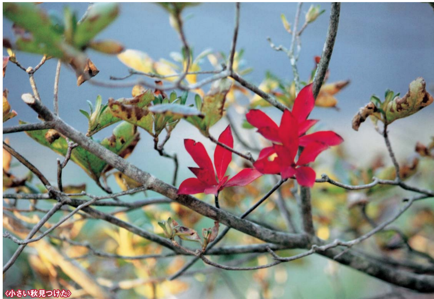
「小さい秋見つけた」

オーナーズクラブ通信／第205回、206回、207回オーナーズクラブ大会の結果報告・2010年日程のご案内 ソーシャルクラブ通信／第14回「夏の音楽の集い」のご報告