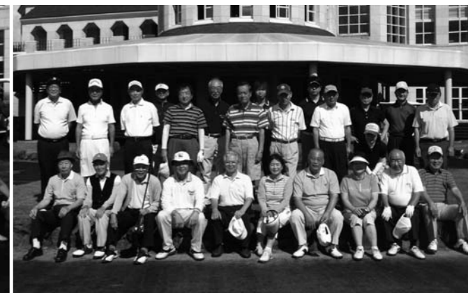
第205回大会 (那須ハイランドゴルフクラブ)

仲間とのゴルフや旅行を通して 那須高原を満喫しませんか？ オーナーズ・ソーシャルクラブ 入会のご案内 入会金・会費無料!! お問い合わせは 那須ハイランド管理事務所 〈担当/市山・山崎〉 TEL.0287-78-1111 FAX.0287-78-1115