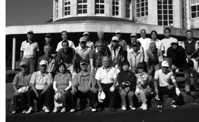
第207回大会 (那須ハイランドゴルフクラブ)