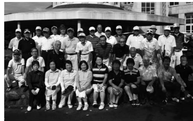
第206回大会 (那須ハイランドゴルフクラブ)