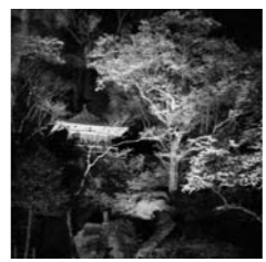
岩観音のライトアップ