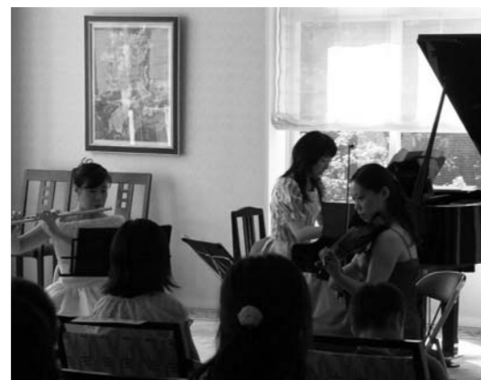
昨年、第13回「夏の音楽の集い」の演奏会風景

仲間とのゴルフや旅行を通して那須高原を満喫しませんか？ オーナーズ・ソーシャルクラブ 入会のご案内 入会金・会費無料!! お問い合わせは 那須ハイランド管理事務所 〈担当/市山・山崎〉 TEL.0287-78-1111 FAX.0287-78-1115