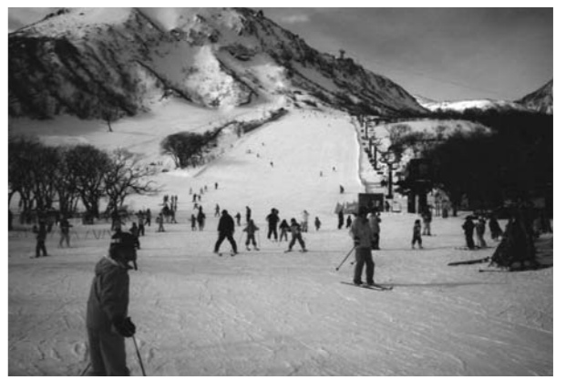
ファミリースキー場