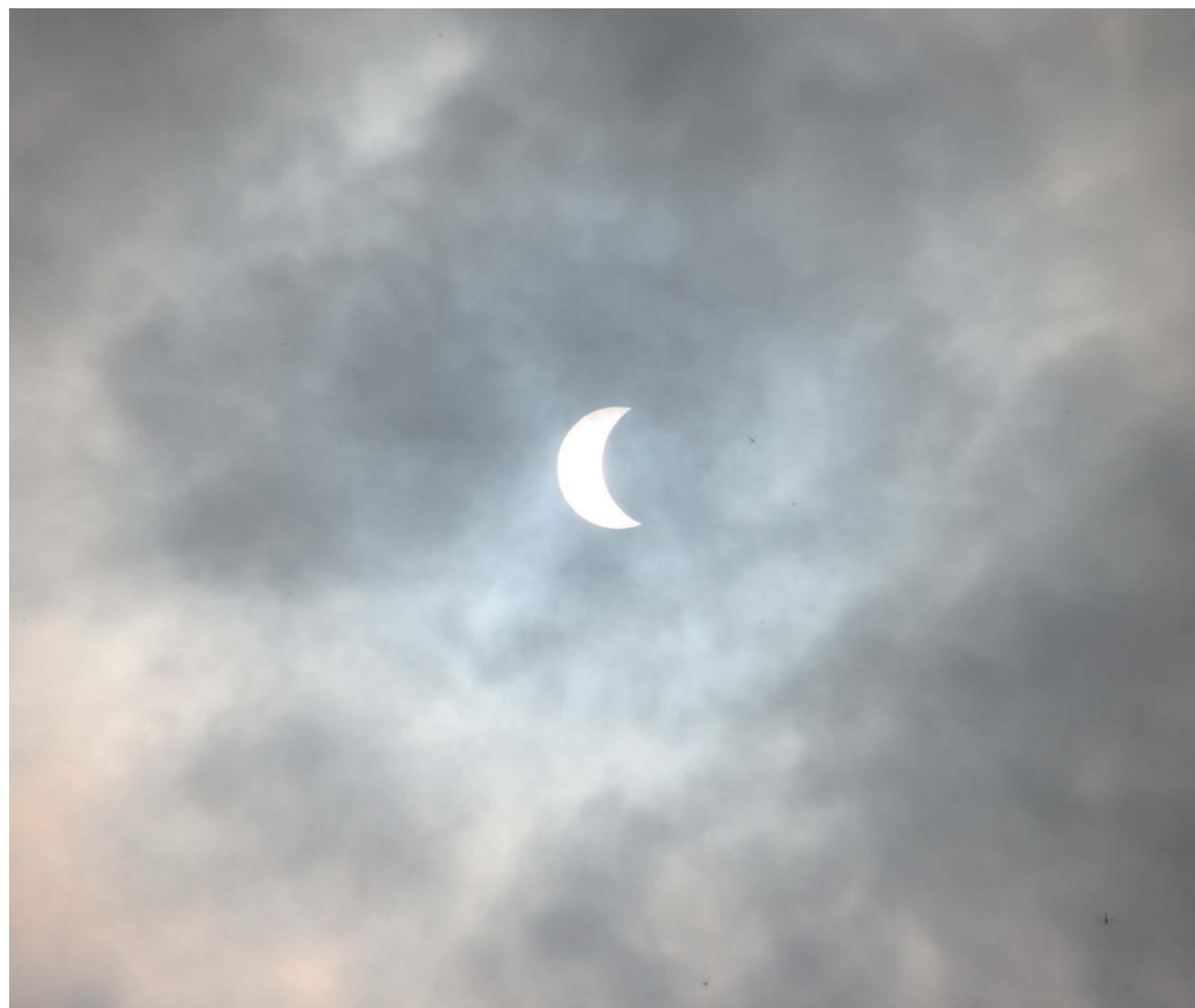
〈写真〉「那須の部分日食 (7月22日)」