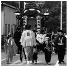
伊王野温泉神社付け祭り

17日・手づくり祭り 18日 ◎道の駅那須高原友愛の森/那須町工芸振興会主催による作品の展示・即売を行います。