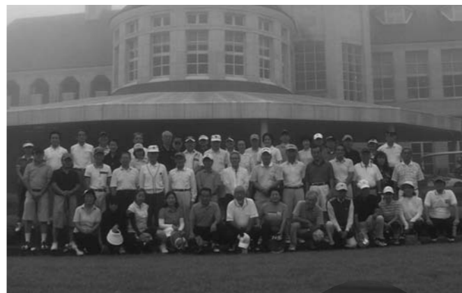
第200回大会(那須ハイランドゴルフクラブ)