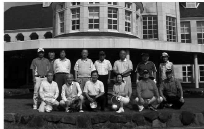
第199回大会(那須ハイランドゴルフクラブ)