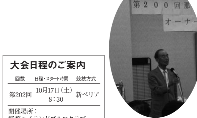
第200回大会開会の挨拶