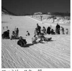
ファミリースキー場

8日 道の駅東山道伊王野 収穫大感謝祭 ◎道の駅東山道伊王野/地粉で新そば祭り、郷土芸能、演芸大会他イベント盛りだくさんです。