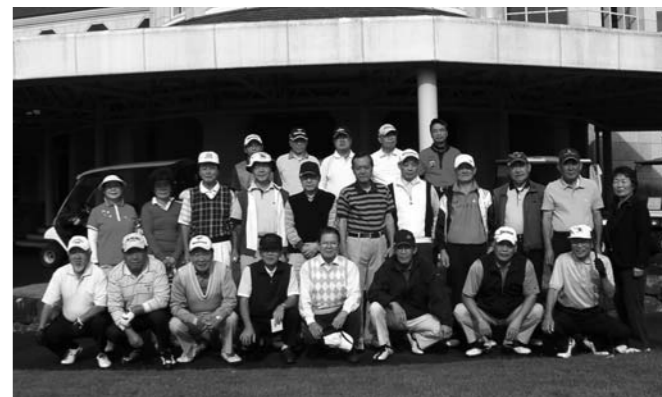
第201回大会(那須ハイランドゴルフクラブ)